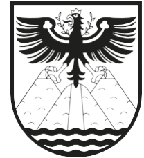
GEMEINDE ST. ANTON AM ARLBERG