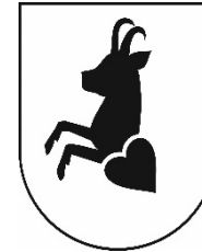
GEMEINDE PETTNEU AM ARLBERG